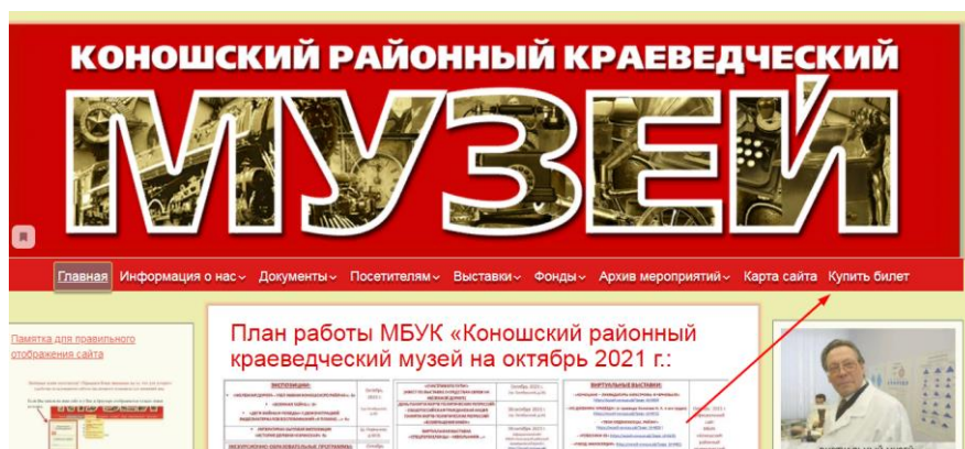
(фото № 1)

ВПЕРЕД – ОКУЛЬТУРИВАТЬСЯ В КОНОШСКИЙ РАЙОННЫЙ КРАЕВЕДЧЕСКИЙ МУЗЕЙ!