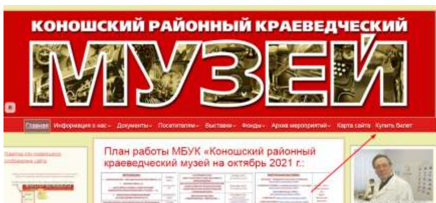
(фото № 1)

ВПЕРЕД – ОКУЛЬТУРИВАТЬСЯ В КОНОШСКИЙ РАЙОННЫЙ КРАЕВЕДЧЕСКИЙ МУЗЕЙ!